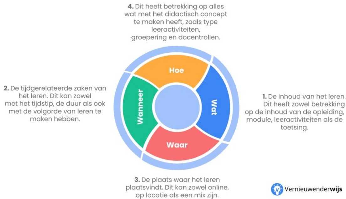
Figuur 1. Dimensies van studentbehoeften ten aanzien van flexibilisering