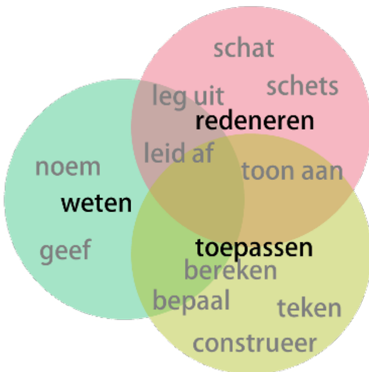
Figuur 3 eindexamen­werkwoorden en TIMSS

Vaak kun je herleiden in welke categorie een (examen)vraag valt door te kijken naar het zogenaamde examen­werkwoord dat gebruikt is. Ook de examen­werkwoorden zijn, per vak, gedefinieerd in de syllabus van het desbetreffende vak. Het vak natuurkunde onderscheidt 11 examen­werkwoorden [7]. In figuur 2 is gevisualiseerd onder welke van de drie domeinen elk van de examen­werkwoorden, bij benadering, valt. In de praktijk hangt het domein waarin een werkwoord valt natuurlijk sterk samen met de complexiteit van de vraagstelling. Daarnaast kunnen er, in één vraag, ook meerdere domeinen aangesproken worden.