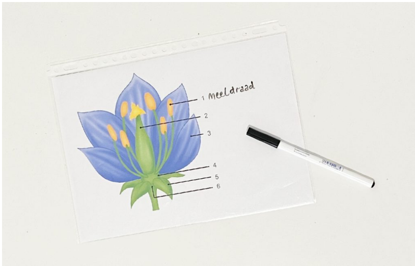
Afbeelding 4: Een afbeelding in een insteekhoes