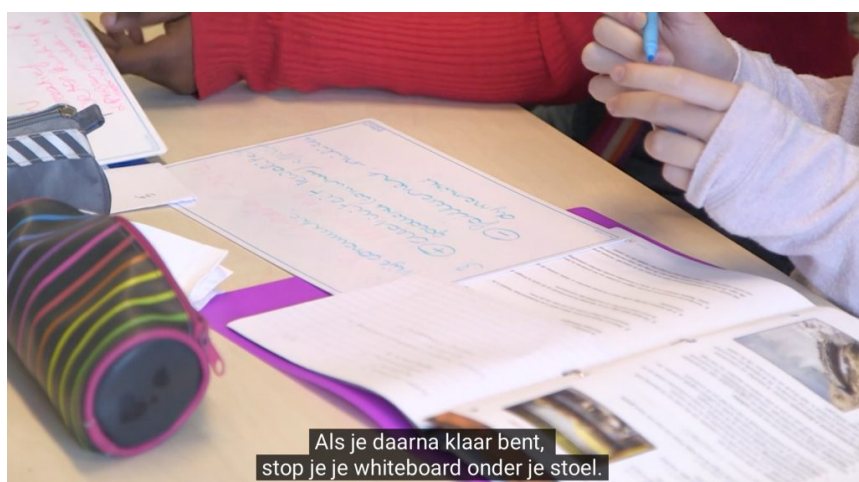
Afbeelding 2: Screenshot uit Klasse, klik op de afbeelding voor de hele video.

Let hierbij op leerlingen die een antwoord verbeteren waar zij zeker van waren. Bij een verkeerd aangeleerd onderdeel is er vaak iets extra's nodig om dit op de juiste manier (opnieuw) aan te leren.