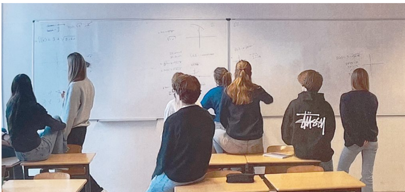
Afbeelding 5: Een white-board muur bij het Vrijzinnig Christelijk Lyceum (VCL)

Veel ruimte creëren om opdrachten uit te werken, kan door grote borden aan de muur te hangen. Het voordeel hiervan is dat jij (en leerlingen in een buitenkring) goed kunt zien hoe leerlingen de uitwerkingen aanpakken. Ook het vergelijken en bespreken van elkaars uitwerkingen wordt zo een stuk makkelijker. Omdat het voor leerlingen makkelijk is om af te kijken, vragen grote borden om een sterke focus op leren (in plaats van presteren), discipline en een duidelijke routine.