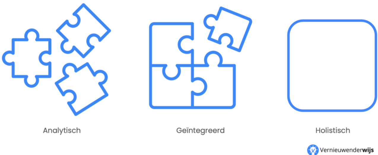
Figuur 2. Van analytisch naar holistisch.

Op basis van de leeruitkomsten dien je vervolgens vast te stellen hoe je wilt toetsen of studenten deze beheersen. In het kader van flexibiliseren spreekt men daarbij over het valideren van de bewijslast . Meer concreet dien je als opleiding vast te stellen hoe de beslissing tot stand komt en hoe daartoe wordt beoordeeld. Een voor de hand liggende keuze is het gebruik van een portfolio-assessment, waarbinnen studenten verschillende type bewijslast kunnen aandragen ter beoordeling. Als opleiding is het daarbij belangrijk om na te denken over de soorten bewijslast: welke producten of handelingen zeggen wat over de leeruitkomsten? Oftewel: welk bewijs heb je nodig om een betrouwbare beslissing te nemen? Dit wordt ook wel decision-driven data collection genoemd (William, 2021). Het is hierbij belangrijk om duidelijke succescriteria te hebben - alhoewel het wellicht niet wenselijk is daar mee te werken .